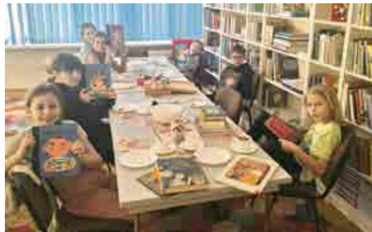
Dziecięcy Dyskusyjny Klub Książki