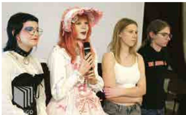
Obornikon, czyli Sobota z mangami