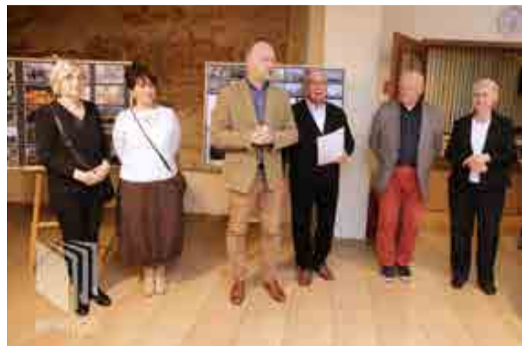
Otwarcie wystawy fotograficznej

siącym! Spotkania w każdy pierwszy wtorek miesiąca.