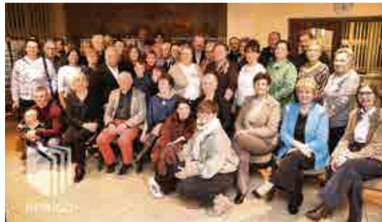
Otwarcie wystawy fotograficznej