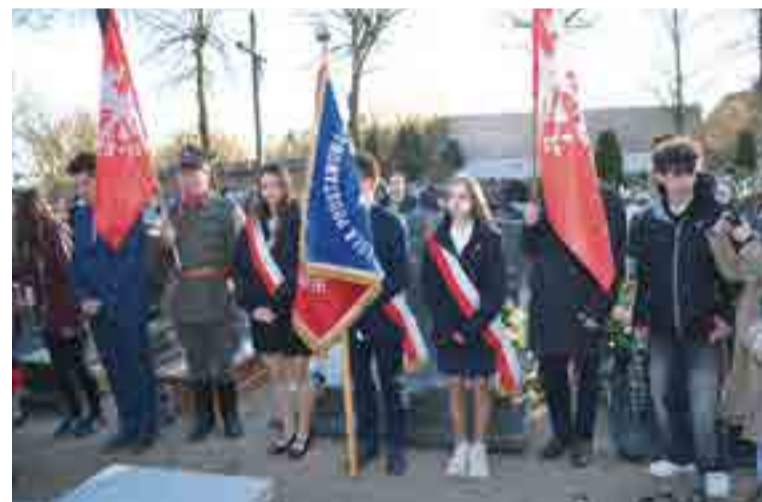
zwykle wartościowe doświadczenie patriotyzmu oraz żywa lekcja historii dla młodych ludzi zaangażowanych w projekt „Silni Polską”. Organizatorzy

Dziękujemy wszystkim za tak liczne uczestnictwo. Było to nie-