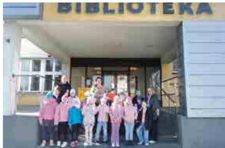
Witajcie w naszej bajce!

Biblioteka to nie tylko miejsce z książkami, ale także przestrzeń do zabawy, odkrywania i rozwijania